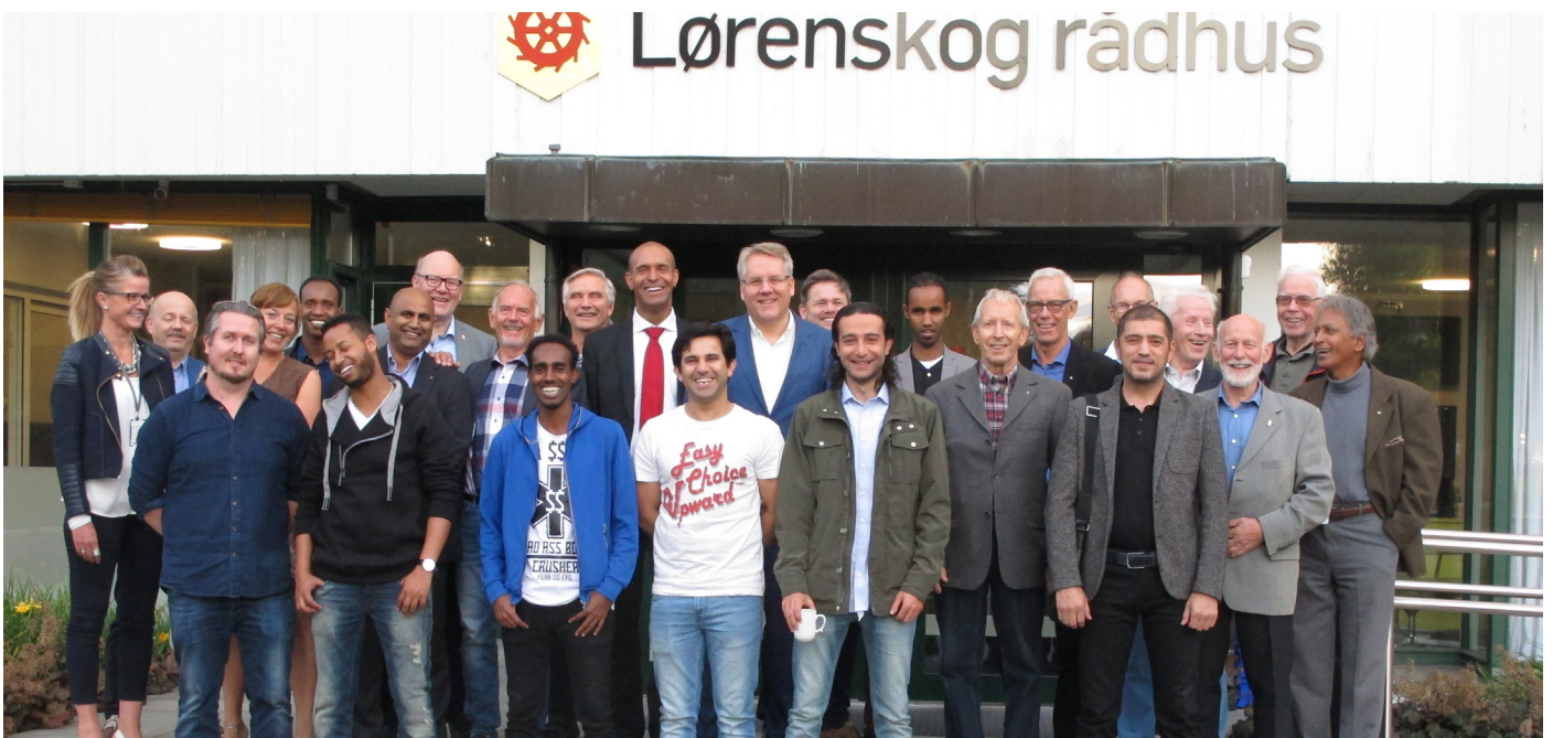
Mentorer og deltakere på flyktingementorprogrammet foran Lørenskog rådhus.