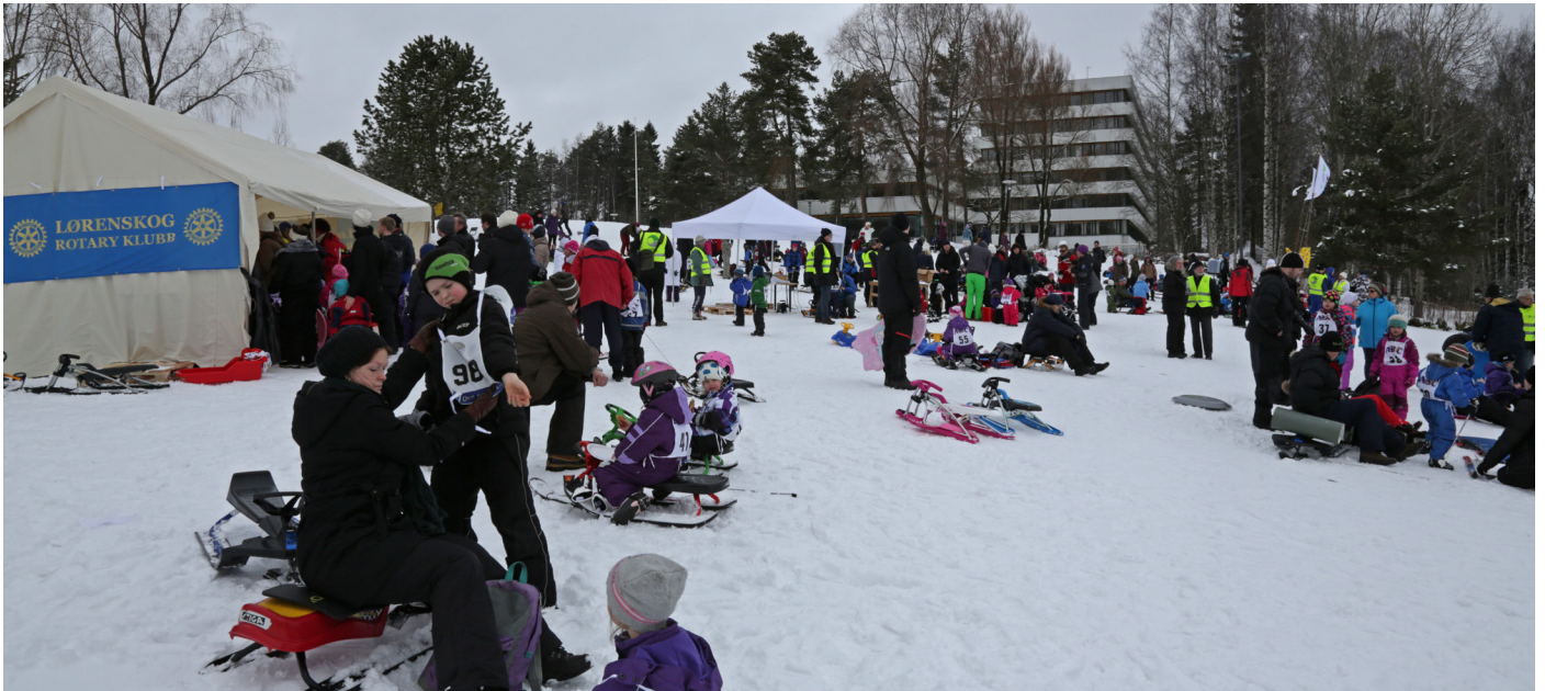
Akedagen 2013: Over 1000 barn og voksne leker i snøen for en god sak.